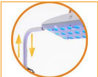
pneumatyczna regulacja wysokości