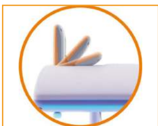
składany wyświetlacz LCD