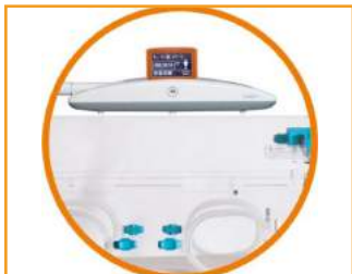
umiejscowienie nad inkubatorami

LED-owa lampa do fototerapii dla noworodków, przeznaczona do obniżenia poziomu bilirubiny u najmłodszych pacjentów.