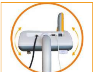
regulacja kąta nachylenia (360 st.)